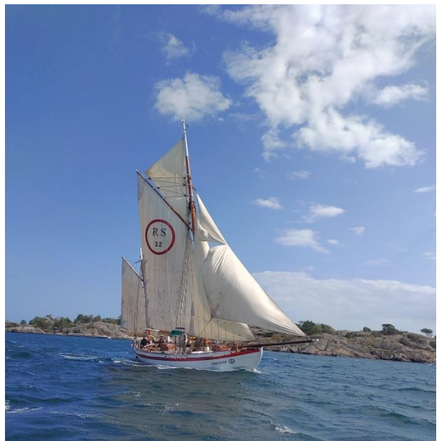
Og med revnet klyver