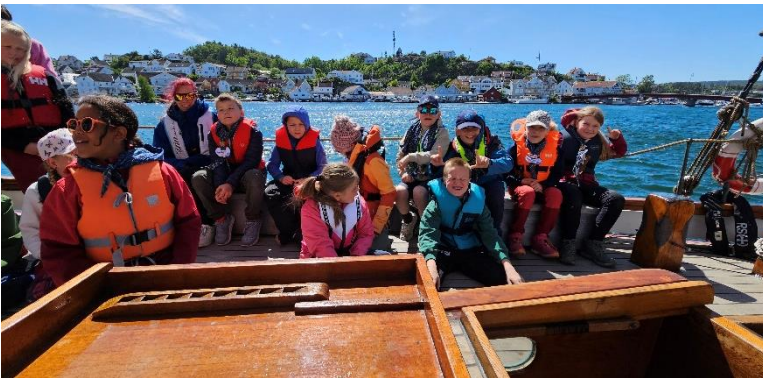
Speiderpatrolje på overnattingstur til Gumøy