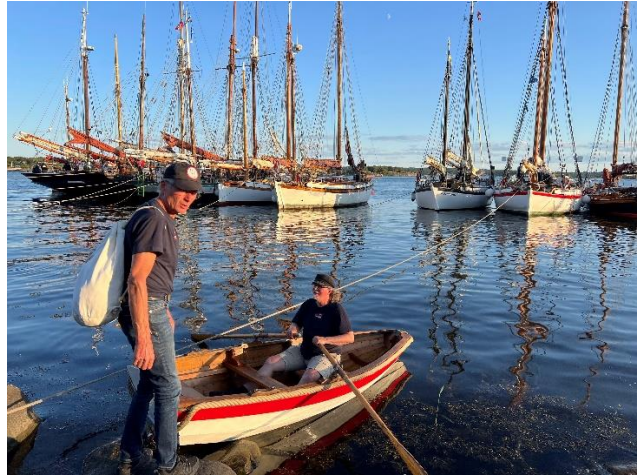
Arisholmen utenfor Fredrikstad