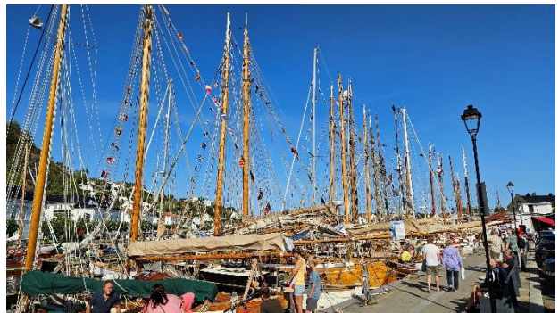
På Trebåtfestivalen i Risør