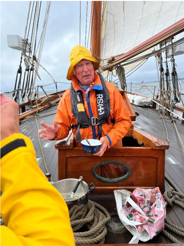
Servering om bord