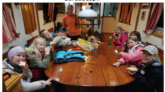
Moro med frokost ombord