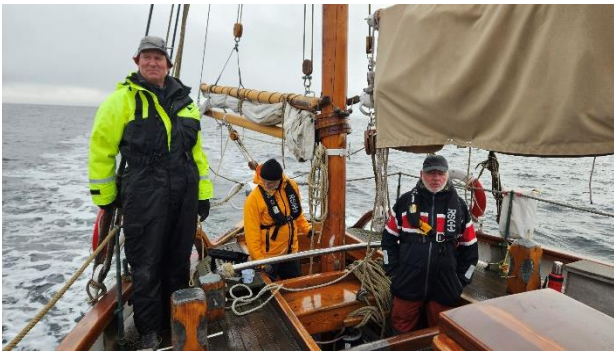
På vei til slippsetting i Risør