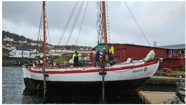
Slippsetting på Skomakerskjær.