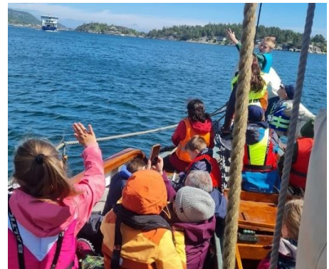
MS KRAGERØ møter RS32 KRAGERØ