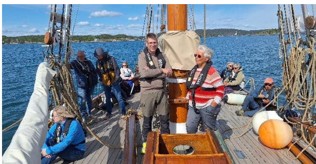
Pilgrimstur til Jomfruland, med Kragerø Menighet