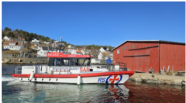
Besøk av UNI-Kragerø !