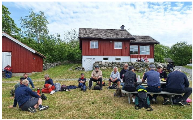
et samarbeid med mange organisasjoner i Kragerø