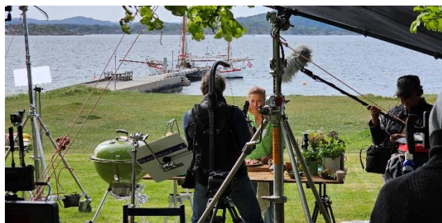
Reklameoppdrag for Kiwi, med «Kiwi-Tina»