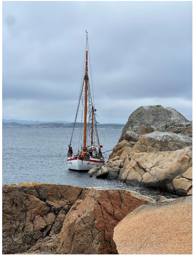
og middag ved Svenner Fyr på hjemveien.