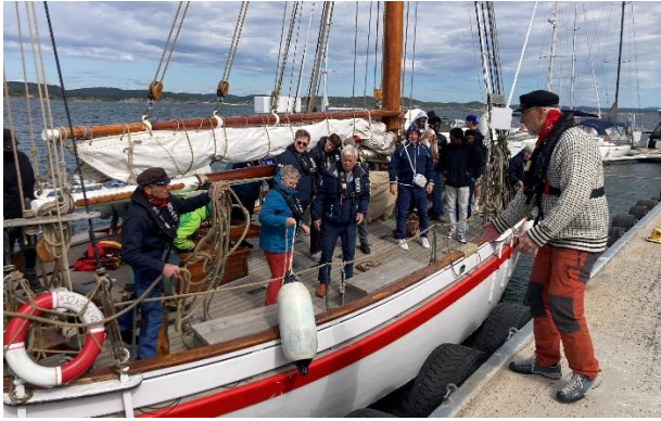
Friluftslivets år, med tur til Jomfruland,