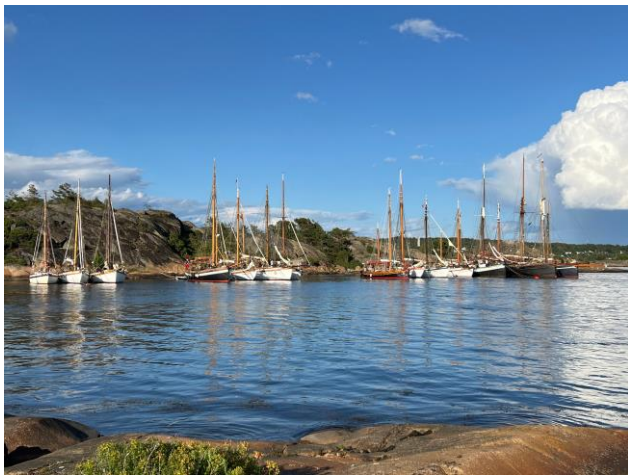
Nordisk skutetreff på