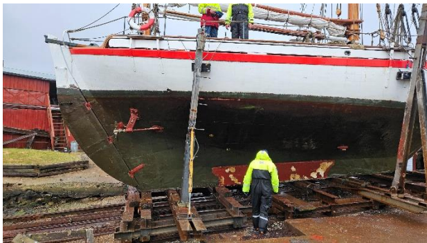
På tørt land. 260 cm under vannlinjen!