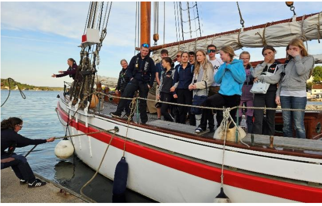
Speiderungdom på tur