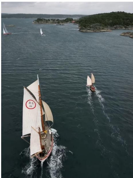
For fulle seil!