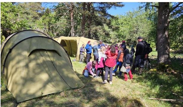
Speiderteltleir på Gumøy